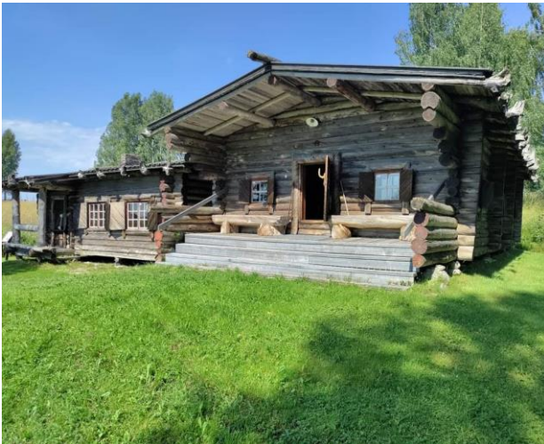
Rajakenraalin Raappanan maja Parpeinvaara