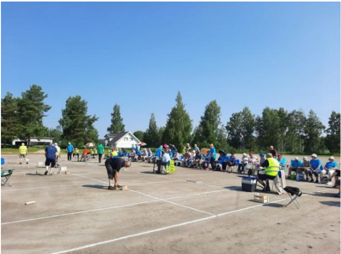
Mölkkykilpailut Koskuen kentällä