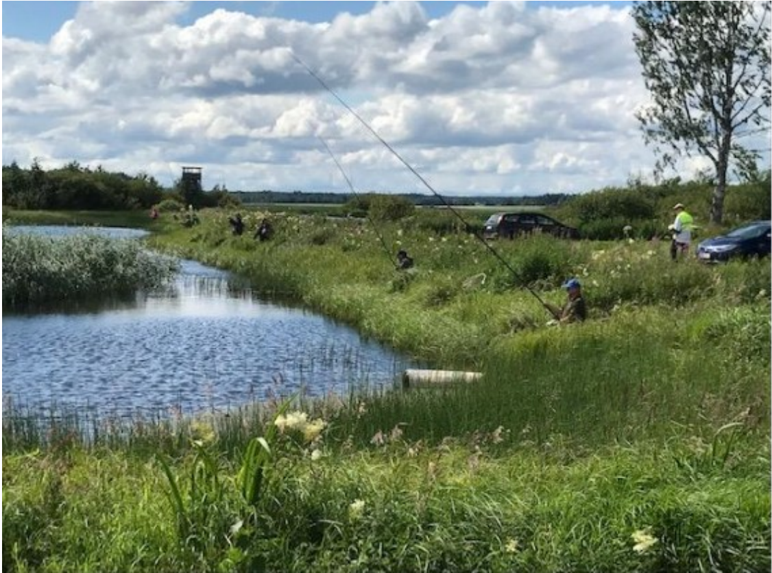
Jalasjärven yhdistys järjesti kahdet piirin kilpailut Rantaonginta Hirvijärven Rapalahdessa