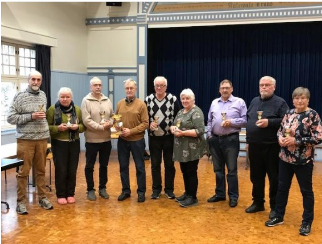
Eläkeliiton Seinäjoen alueen tietokilpailu Jalasjärvellä 11.10.2022