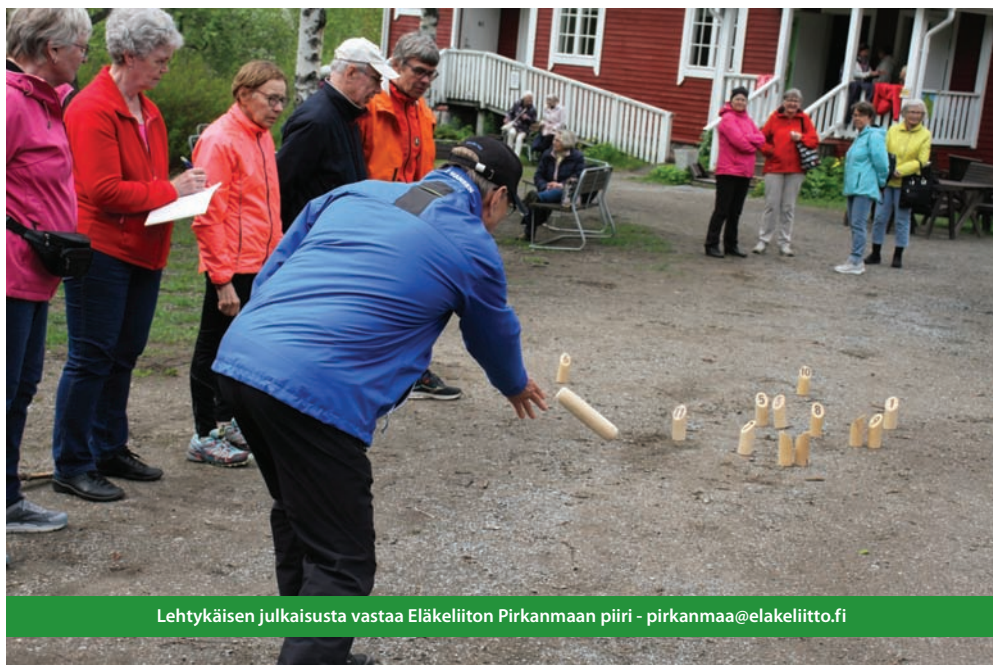
Lehtykäisen julkaisusta vastaa Eläkeliiton Pirkanmaan piiri - pirkanmaa@elakeliitto.fi