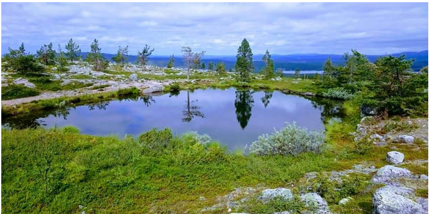
Suomen kaunein tunturi, Särkitunturi!

käritykset. Ruoka oli lähiruokaa ja todella maittavaa, siitä kaikki olivat yksimielisiä. Yksi ja toinen alkoi valitella housunkauluksen kireyttä ja painon lisääntymistä? Vielä olisi yksi paikka Särkitunturi. Siellä minua ainakin yllätti ihmispaljous. Kaikkein eniten mitä muissa paikoissa. Kuukkeleitakin tuli nähtyä.