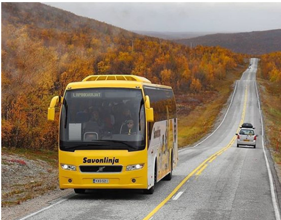
Suuri kiitos mukavalle lapinkävijä porukalle, mainiosta reissusta!