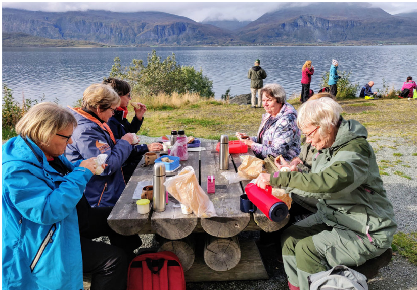
Eväät maistuivat Norjassa!