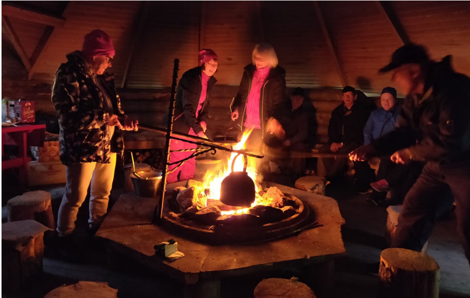
Naurun remakkaa, lettuja ja nokipannukahvia, NAM!