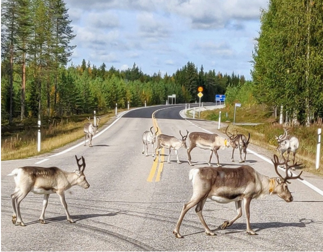
Poroja oli runsaasti liikkeellä!

Aamu valkeni pilvisenä, kun lähdimme kohti Lappia ihailemaan ruskanehkua. Sehän alkoi melkein tasan klo 15.08. Meitä on ihan kivankokoinen porukka matkassa. Kirjoittaneelle tämä on ensikosketus lappiin. Odotan innolla, millaista siellä on vaarojen ja tunturien maisemissa.