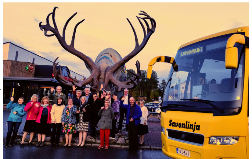
Iloinen tanssiporukka matkalla Riemuliiteriin!

Nykyisin kalapirtit ovat yksityisomistuksessa ja lukittuja. Ne ovat edelleen käytössä, kun muoniolaiset käyvät kalassa Jerisjärvellä. Rivissä seisovat kalapirtit ovat kulttuurihistoriallinen nähtävyys ja ehdottomasti näkemisen arvoisia. Tänään, kun oli "helpompi" päivä jäi voimia vielä lähteä viihteelle. Pitää nyt kerran päästä käymään Riemuliiterillä. Siitähän kaikki puhuu, ketkä ovat Lapissa käyneet. Nyt sekin tuli käytyä ja koettua.