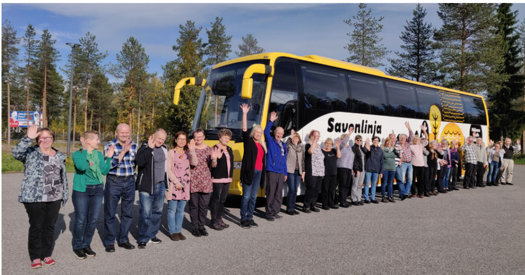
Napapiirin ylitys seremonia alkamassa?

Ja sitten oli napapiirin ylitys. Se on tehtävä kaiken taiteen sääntöjen mukaan, muutoin napapiiri jää ylittämättä. Se tapahtui Joulupukin pajalla. Sehän meni niin, että... enpä taida kertoakaan ..... siitähän meni koko viehätys, jos sen paljastaa?